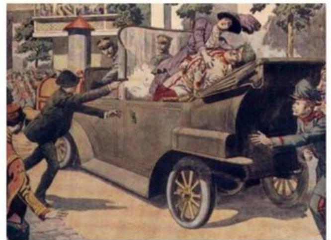
L'assassinat de l'Archiduc d'Autriche à Sarajevo le 28 juin 1914.