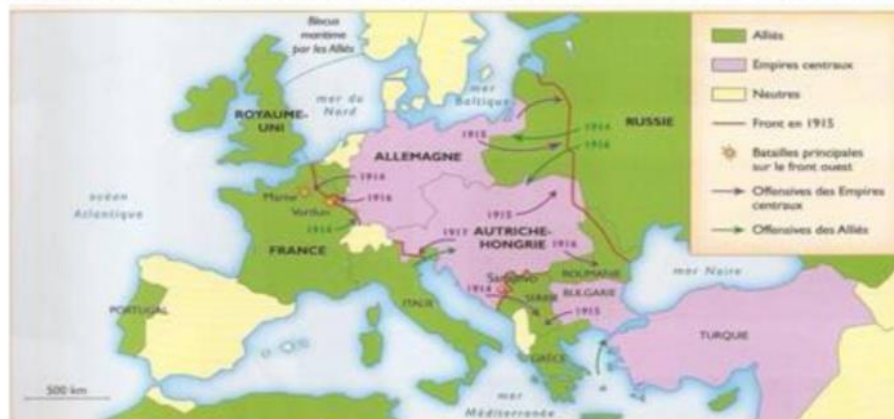
L'Europe en guerre