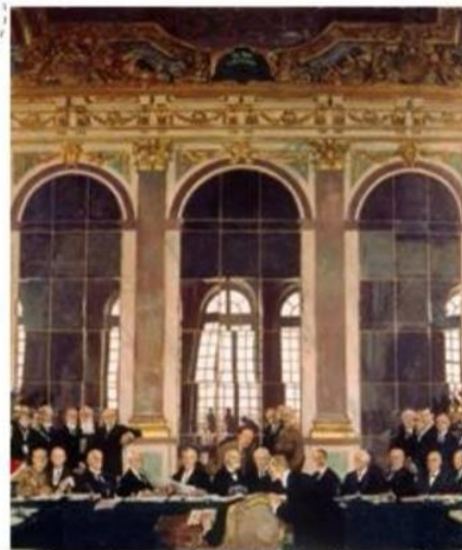
La signature du traité de Versailles (Tableau de W. Orpen, 1919)