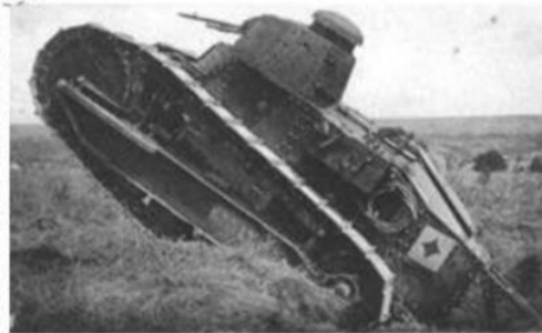
Un char Renault